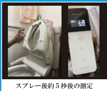
スプレー後約5秒後の測定