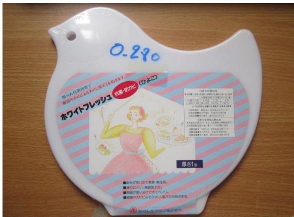
(高さ20.5cm×横幅21.5cm) 厚さ 1cm タイプ、ポリエチレン